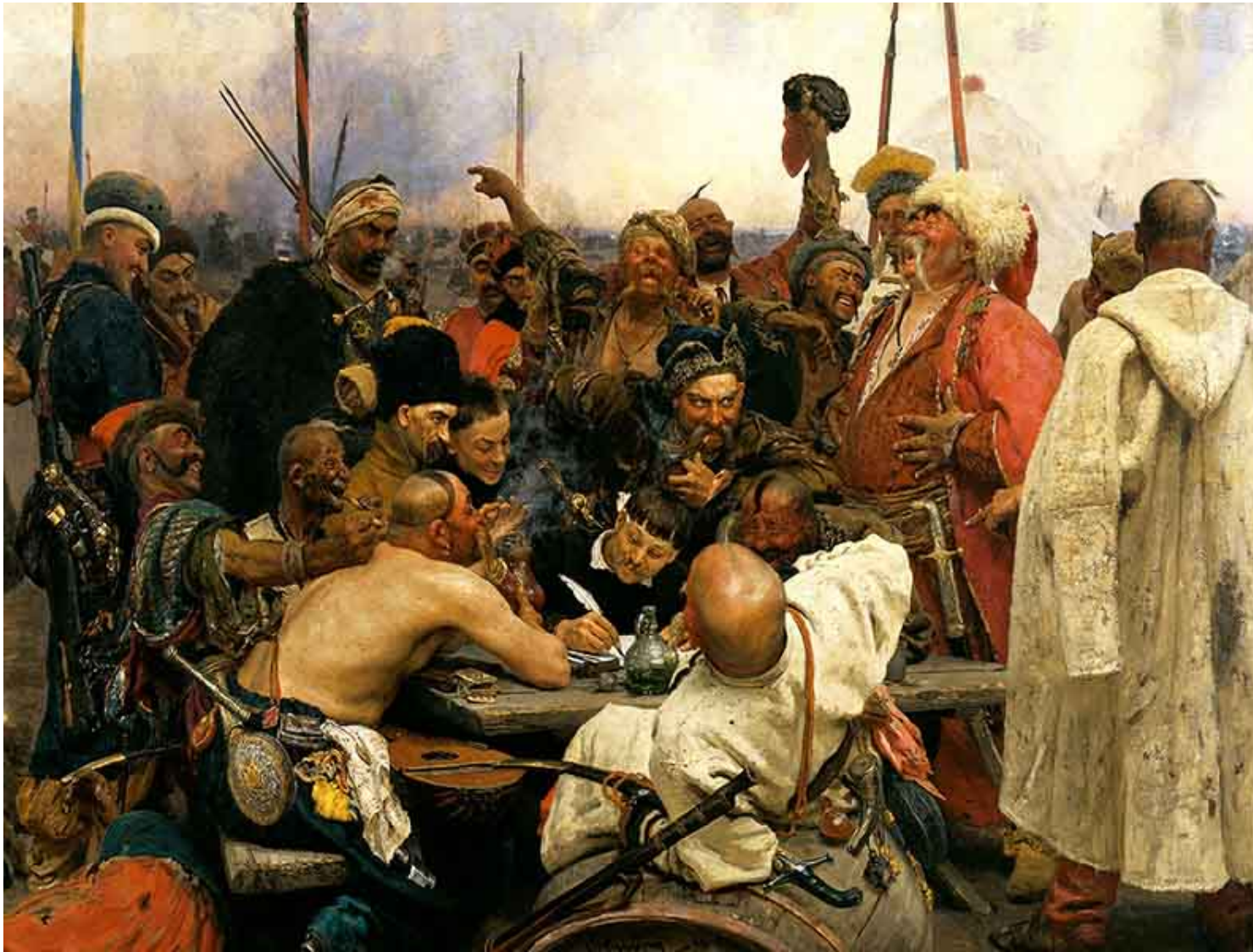
Репин. Казаците пишат писмо на турския султан