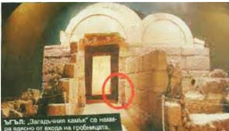
ЪГЪЛЪ „Загадъният камък“ се намира вдясно от входа на гробницата.

ХИПОТЕЗАТА за Сборяново като гигантски архео-астрономически комплекс се потвърждава и с