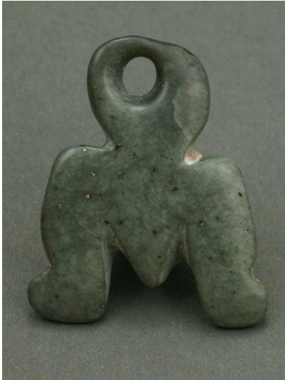
Идолна пластика, намерена в Русенската селищна могила

В праисторическия фонд на музея в Русе се съхраняват повече от 7000 находки от периода 8000-4000 г. пр. н. е.