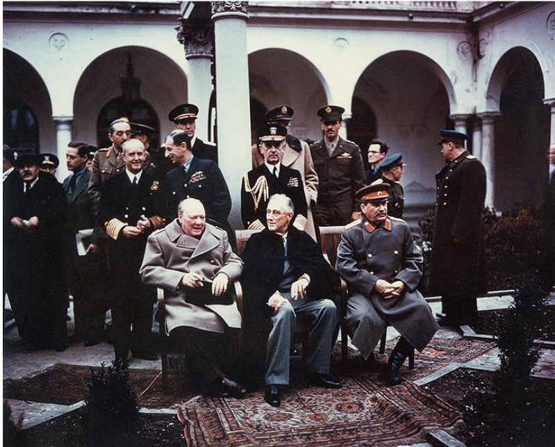
Churchill, Roosevelt & Stalin at the Yalta Conference, February 1945

сили - Англия, Франция, Германия, Русия, Америка. Ясно е, че те никога не са имали и най-малк