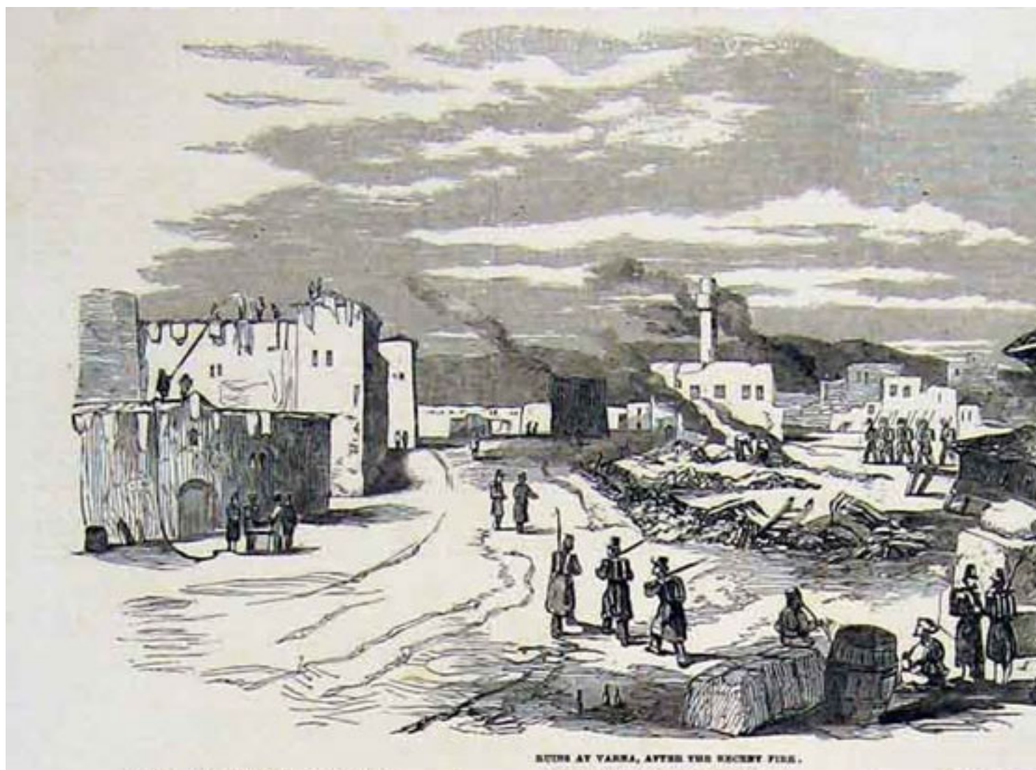
5. Варна след пожара

След пожара една седма част от Варна е в развалини (Bazancourt 1856: 143). Изгарят 500 къщи