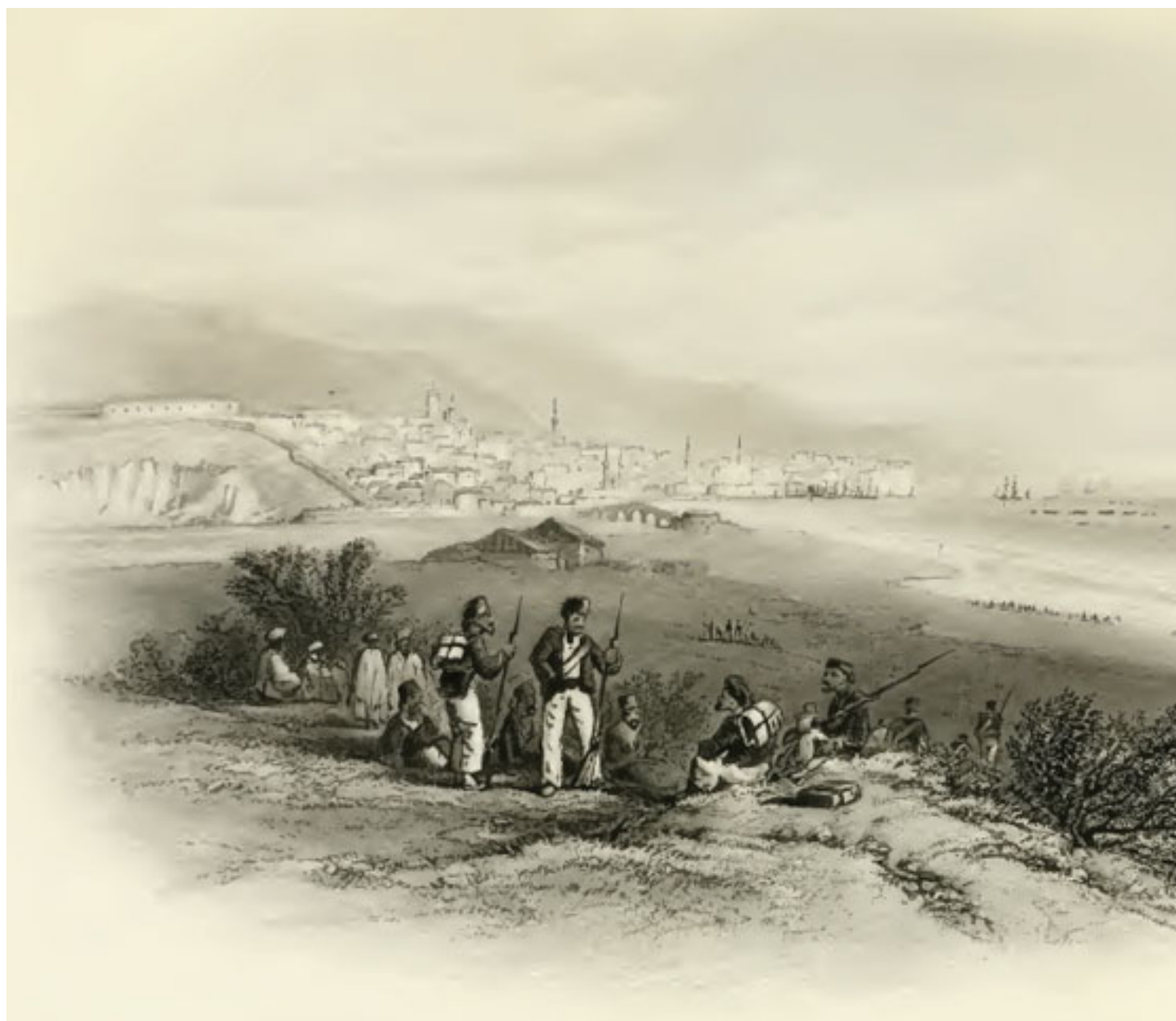
1. Варна през 1854 г. - общ изглед

При обсадата на Варна през 1828 г. (по време на Руско-турската война от 1828-1829 г.) варненски