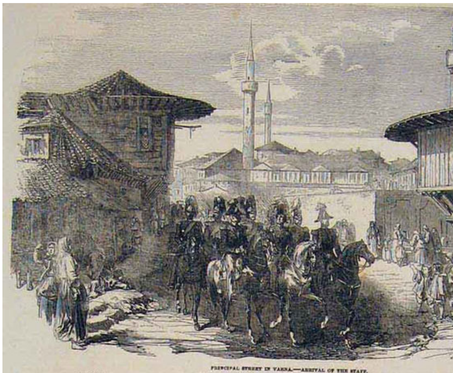
2. Главната улица на Варна - пристигането на щаба

След дебаркирането на англо-френските войски във Варна зад крепостните стени са разтоварени