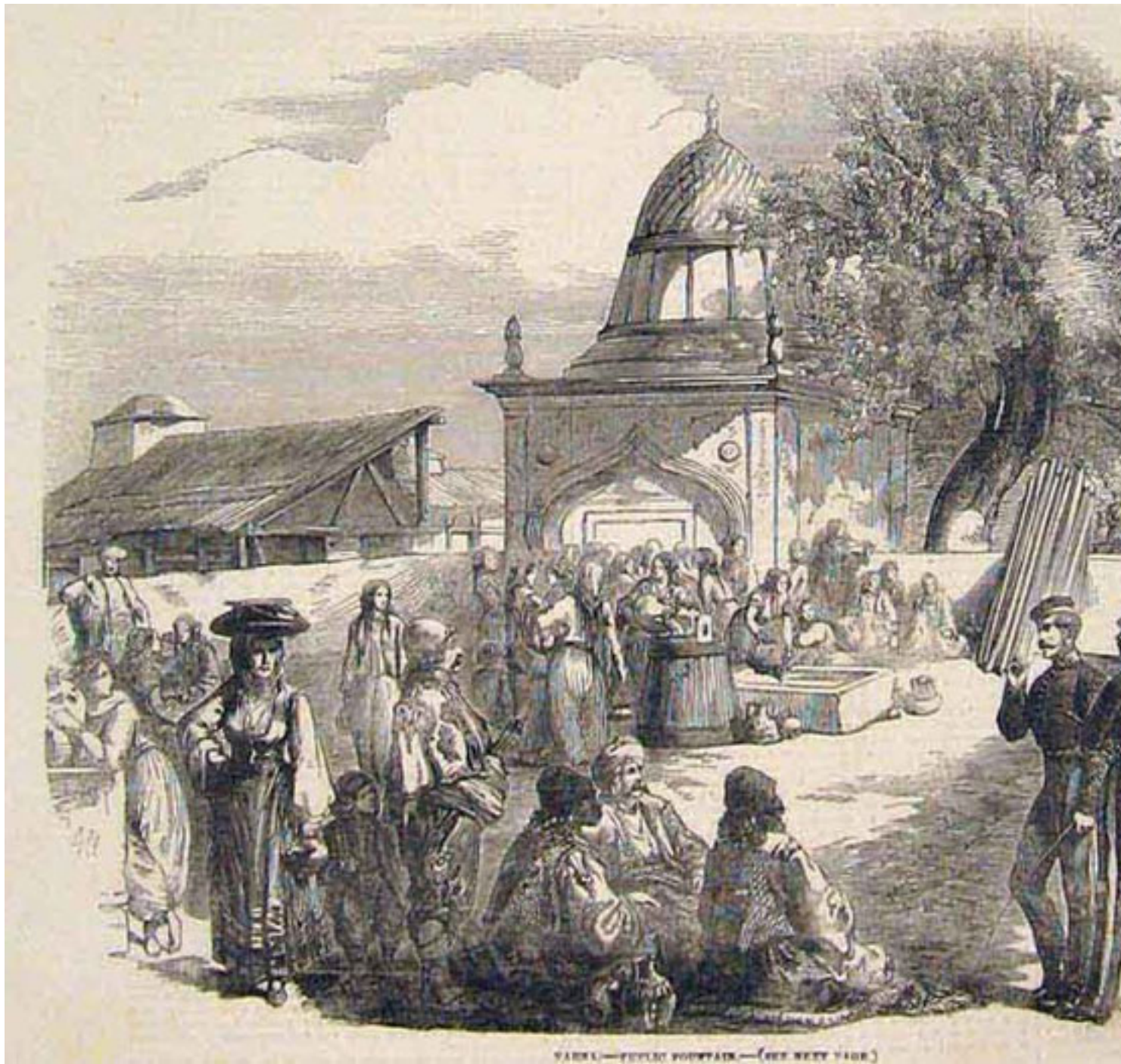
4. Варна - обществена чешма