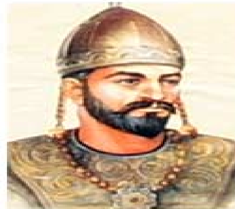
Khan Presian 836 - 852