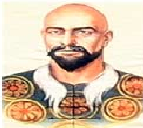
Khan Omurtag 814 - 831