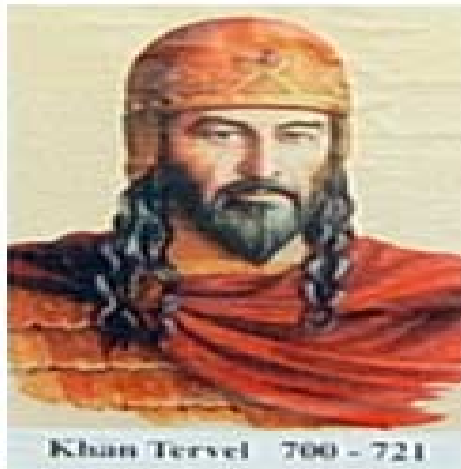
Khan Tervel 700 - 721