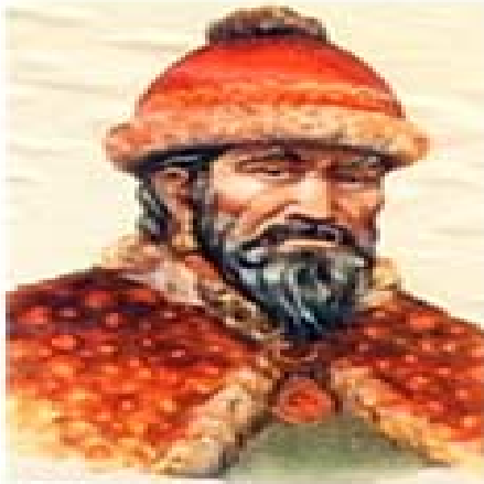
Khan Krum 803 - 814