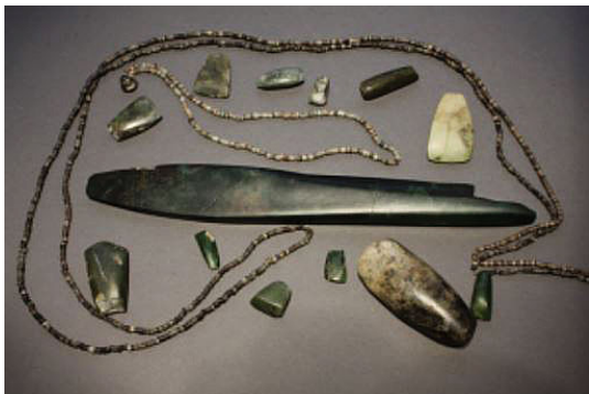
Колекция от нефрит в италиянския музей в Перник от археологическите разкопки в местността "Дупка" в местността "Дупка" в Перник

Теорията на археоложката Анета Бакъмска е , че вероятно нефритени находища е имало на Ба