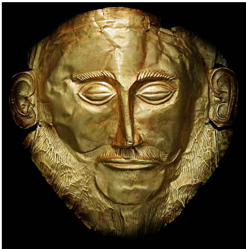
Маската на Агамемнон в Грндотласеесеенева. Направена от злато от находищата на Ада тепе, Олимп

▣ Маската на Агамемнон. Предполага се, че е направена от златните находища на Ада тепе