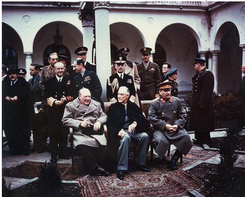
Churchill, Roosevelt & Stalin at the Yalta Conference, February 1945

сили - Англия, Франция, Германия, Русия, Америка. Ясно е, че те никога не са имали и най-малк